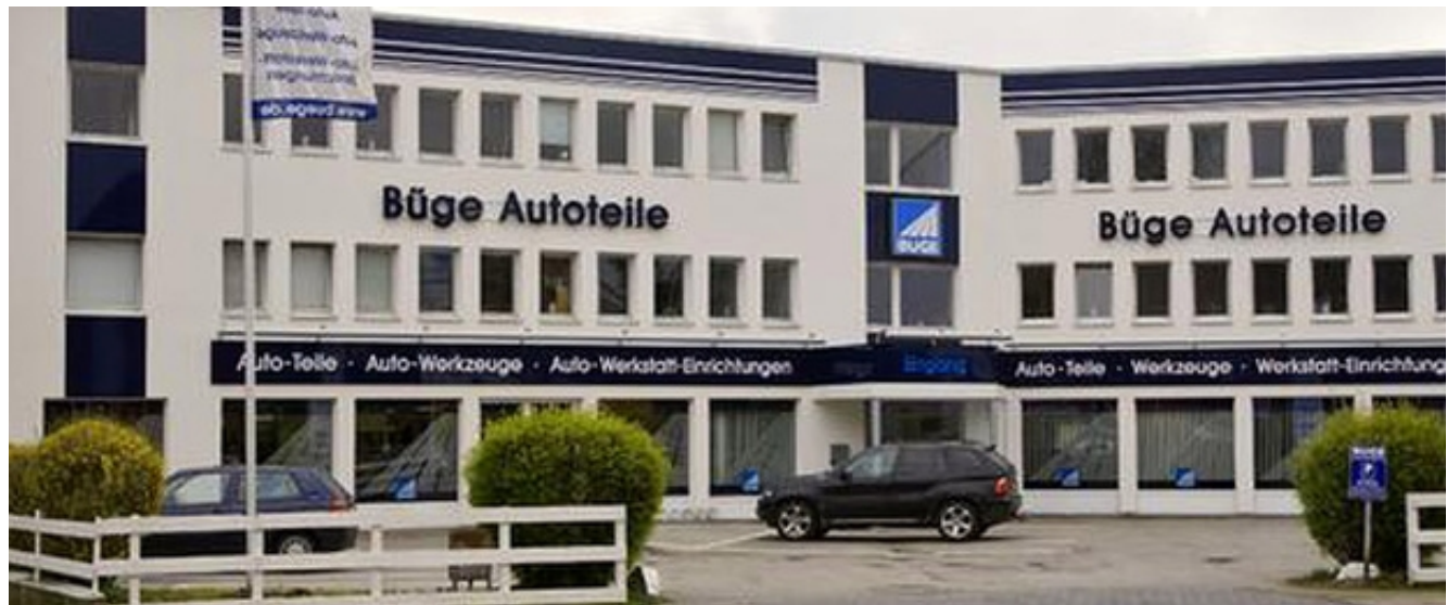
Siège de Büge en Allemagne